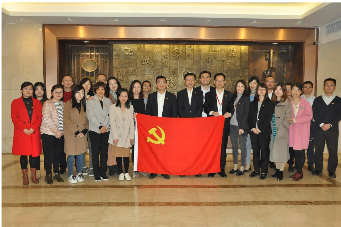
2018年12月3日，工银安盛直属第一党支部党员参观“廉至诚，洁致远”金融业廉洁历史文化展