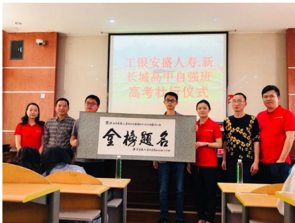
四川雅安汉源二中“高考壮行会”

除了资金资助，本司还通过形式多样的关爱措施，如定期组织员工开展志愿者活动，与受助学生互动交流等，帮助受助学生身心健康成长。欢迎自强班学生在公司实习，学生毕业后可优先录取为正式员工。