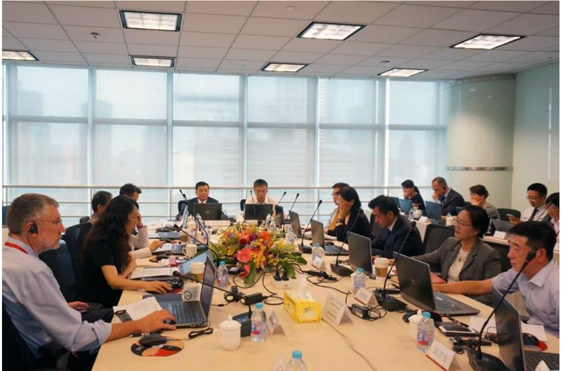
2018年7月25日，本司召开第二届董事会第二十一次会议。