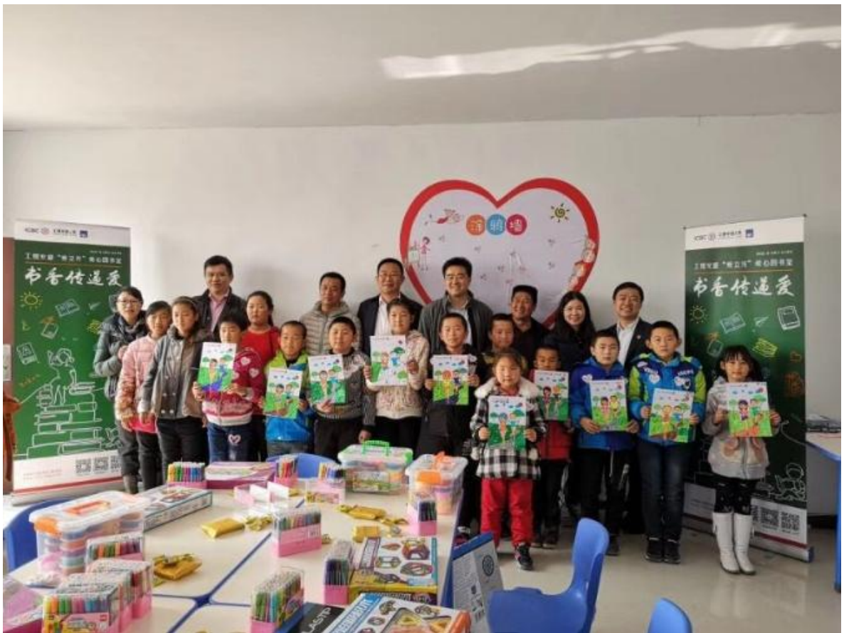
内蒙古自治区察右中旗巴音乡中心小学爱心图书室