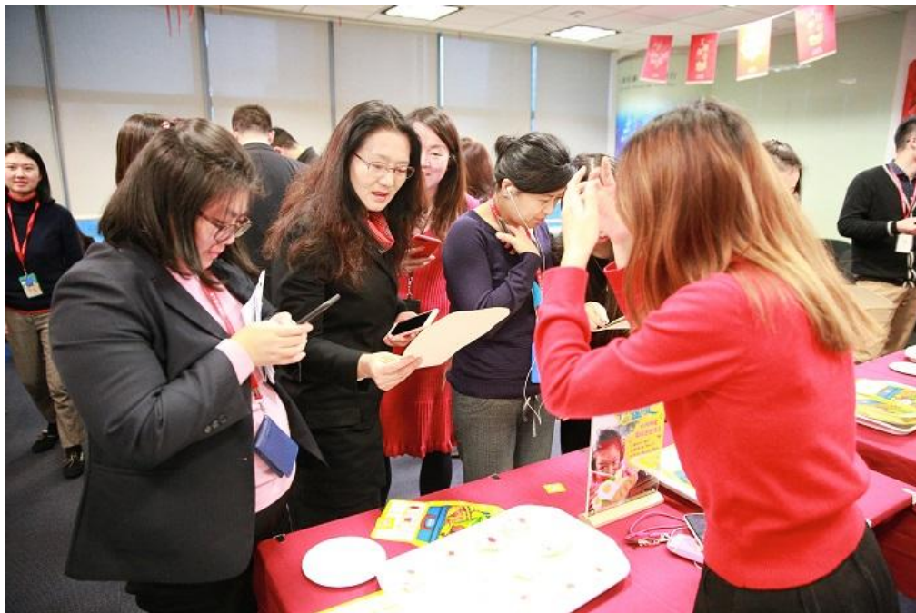
“一份早餐的温暖”现场捐赠活动

报告期内，本司响应中国保险协会 7.8 扶贫公益基金活动的号召，在全国系统开展了“一份早餐的温暖”公益活动。该活动通过募集捐款，为云南省贫困地区小学的孩子进行早餐营养加餐，改善贫困地区儿童的营养状况，为学生提供生活资助和成才支持，经统计，全司捐款人数总计 4916 人，筹集善款 179,565.14 元。