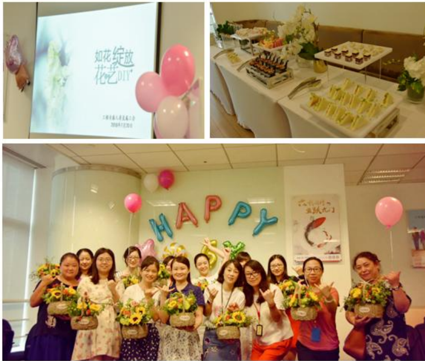
本公司直属工会组织员工参加插花活动