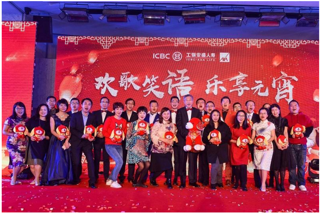
本公司举办 2018 年度元宵团拜会