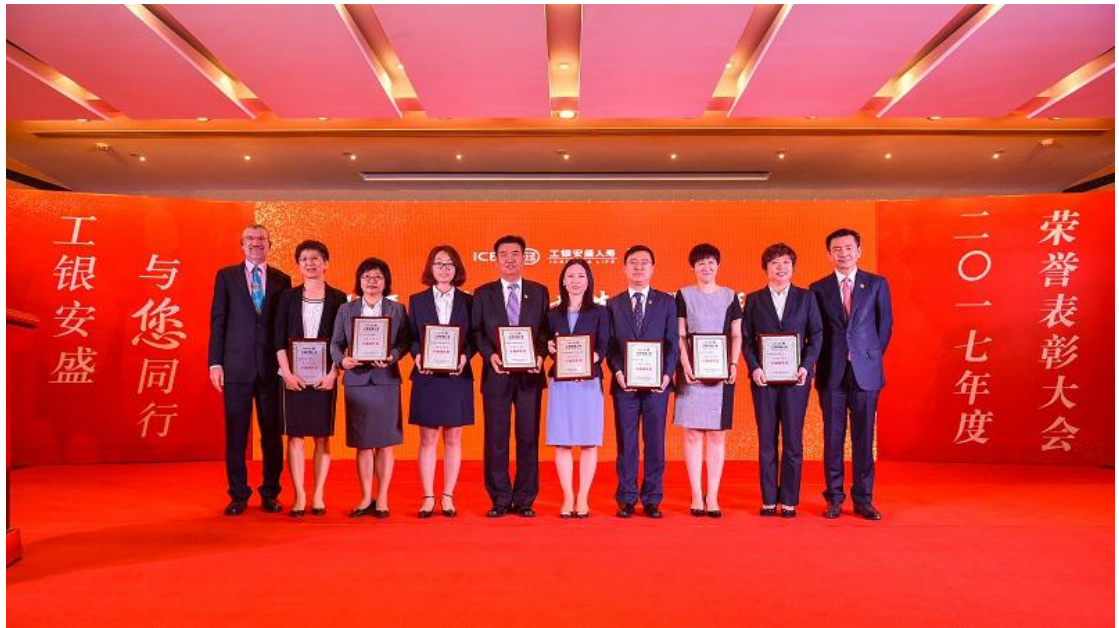
2018年7月4日，公司召开2018年度员工荣誉表彰大会