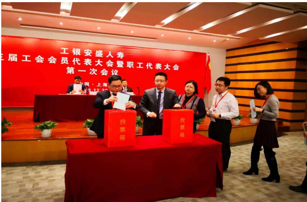
本司员工在职工代表大会上投票

报告期内，召开了第三届职工代表大会，全司职工代表通过无记名投票，选举出第三届工会委员会委员和新一届工会主席。