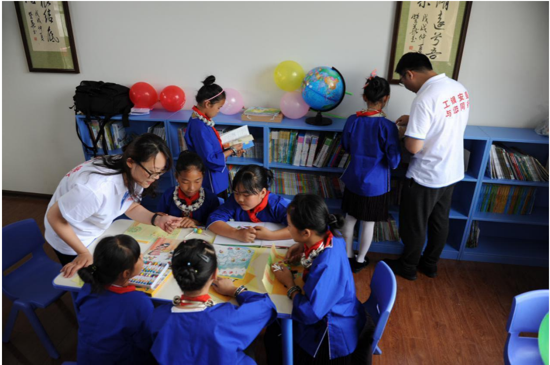
广西省三江县三团小学爱心图书室