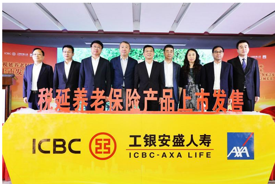
本司税延养老保险产品正式上市发售